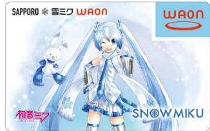
Illustration by KEI © Crypton Future Media, INC. www.papro.net piapro