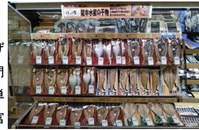
〈能本水産 干物各種〉