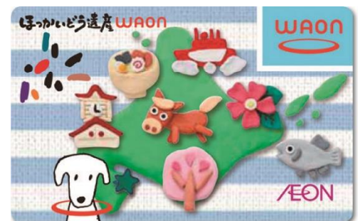
〈ほっかいどう遺産WAON〉

北海道とイオン株式会社は、双方が持つ資源を有効に活用し、北海道の一層の活性化と道民サービスの向上に協働して取り組むことを目的に、2011年7月に包括連携協定を締結し、その取り組みの一つとしてご当地WAON「ほっかいどう遺産WAON」を発行しています。このカードをイオングループ各店舗やWAON加盟店で利用していただくことにより、その利用金額の一部を北海道遺産協議会に寄付し、各地の北海道遺産を次の世代に引き継いでいく活動に役立てていただいております。