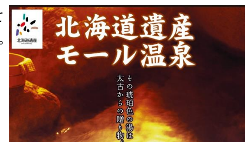
〈音更町十勝川温泉モール温泉〉

なお、音更町十勝川温泉の「モール温泉」も北海道遺産に登録されており、「ほっかいどう遺産WAON」を通じて当社も応援しています。