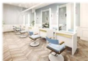
美容室 N Y N Y