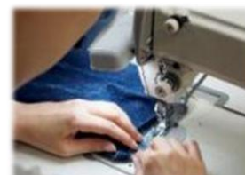
ママのリフォーム