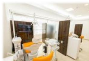
東淀川ひかり歯科クリニック