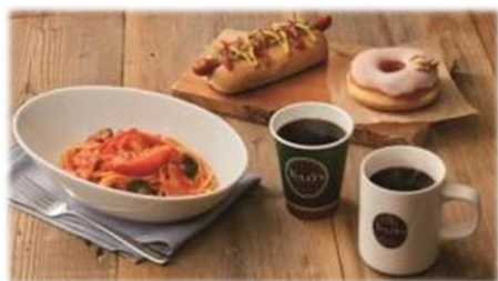
タリーズコーヒー

また、イオンの自転車専門店「イオンバイク」では、「日常生活のお手伝い」をコンセプトに、普段使いに活躍するシティサイクル、電動アシスト自転車をはじめ健康ニーズや通勤・通学的手段として注目されているスポーツサイクルも取り揃えます。スポーツサイクルでは、日本人向けに開発したイオンバイクオリジナルブランド「KAGRA（カグラ）」を展開するなど、厳選した品揃えで「お客さまにぴったりの1台」を提案します。さらに、他店で購入された自転車の修理も承ります。